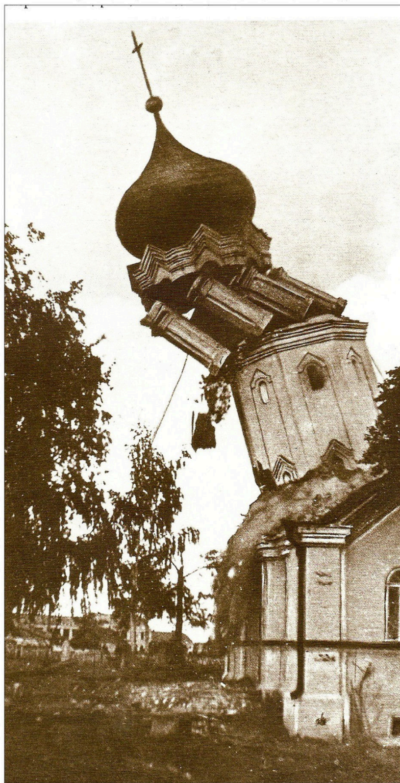
№ 2. Взрыв колокольни Крестовоздвиженской церкви